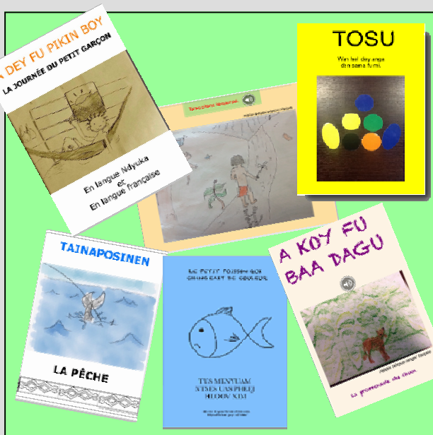
Livres bilingues produits par les ILM dans les Grac et les séminaires du dispositif académique.